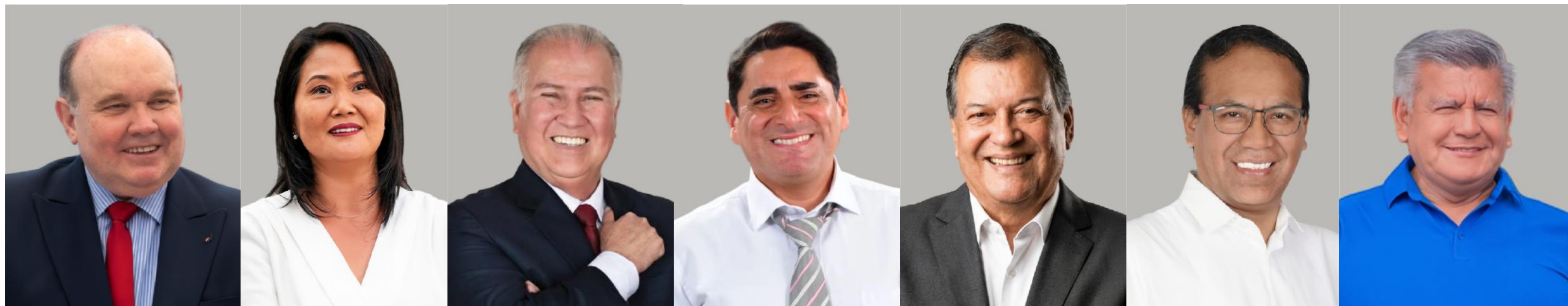
RAFAEL LÓPEZ ALIAGA

Resultados de la última encuesta de DATUM, IPSOS y CPI: